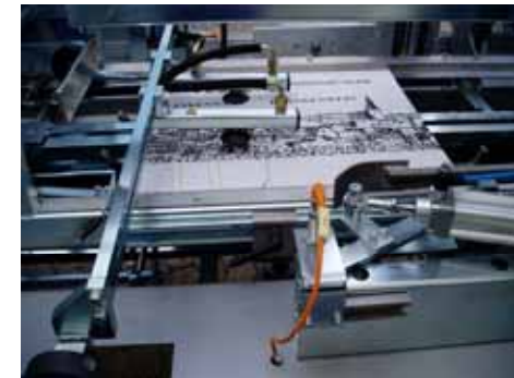
Aufzugsstation mit Zuschnitt