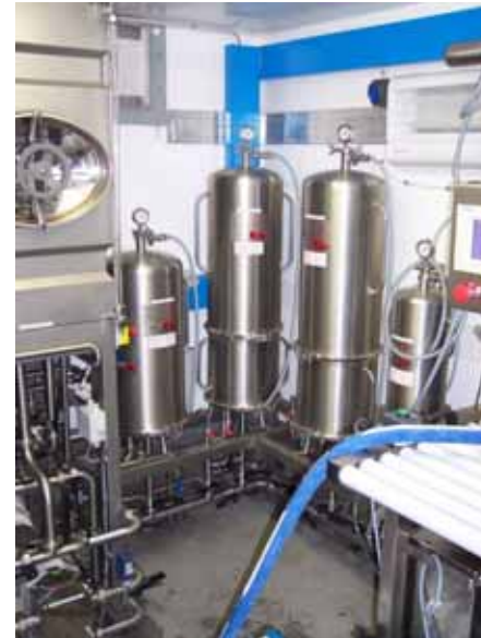
Puffer und Tanks sowie Pumpen