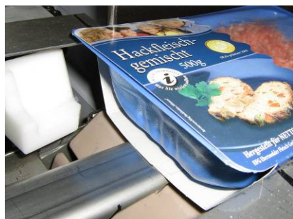
fertig banderoliertes Päckchen