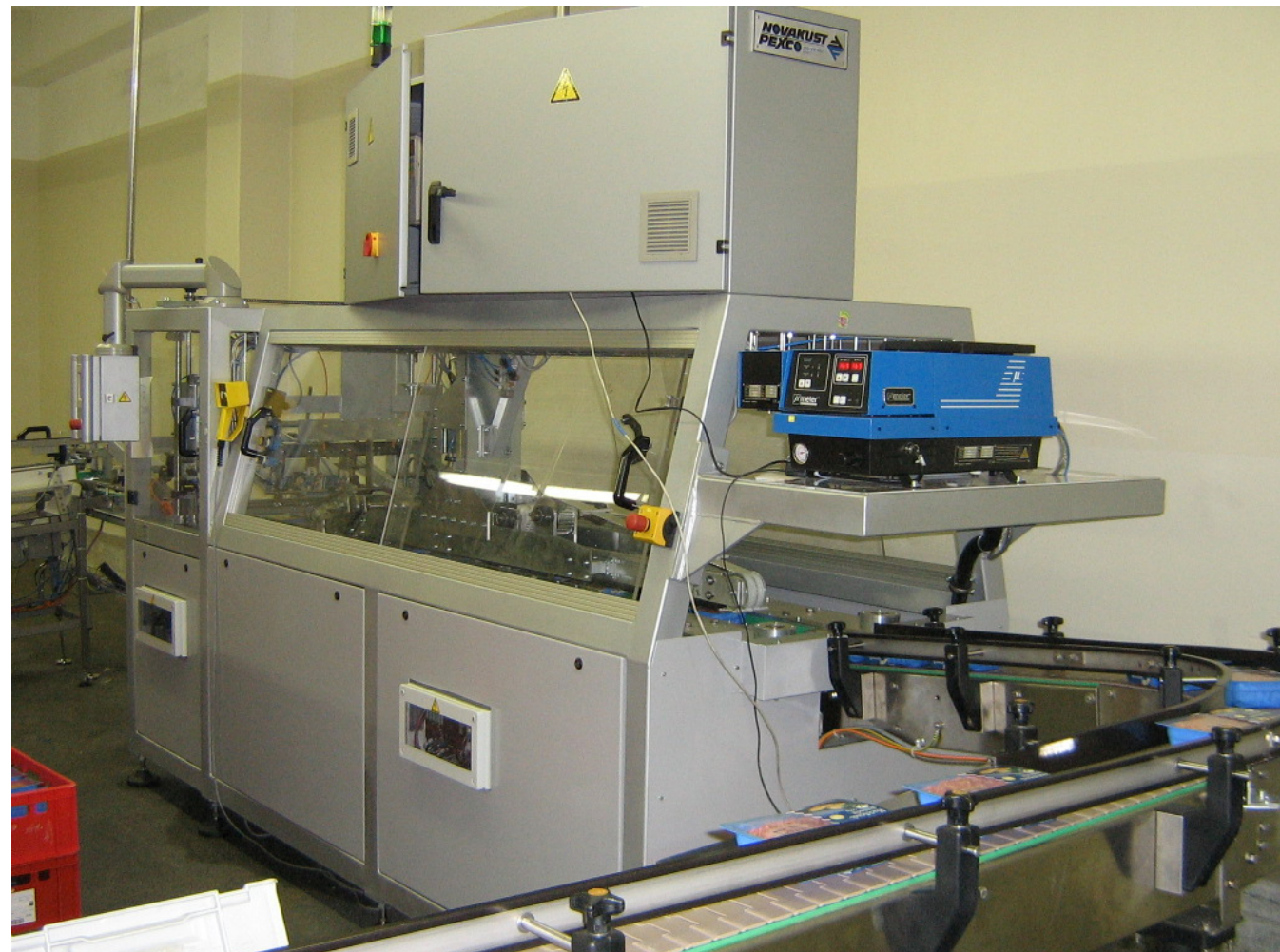
Multipackmaschine mit Auslaufband und Paktisch (im Vordergrund)