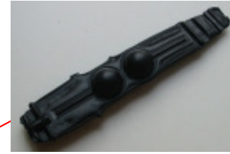
Blasteil : Die Ventilschwimmer werden ausgestanzt