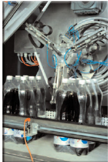
▼ Packung im Eingriff